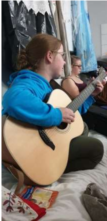
Vaba aeg on mõnusalt sisustatud...