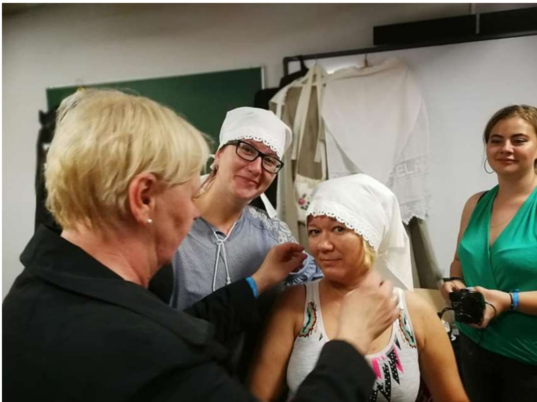
...ja ettevalmistused juubelitepeks käivad.