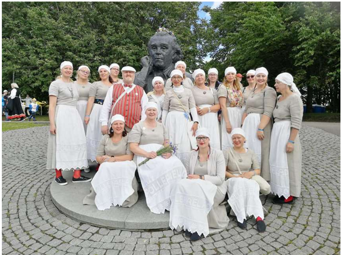
Siin me oleme.