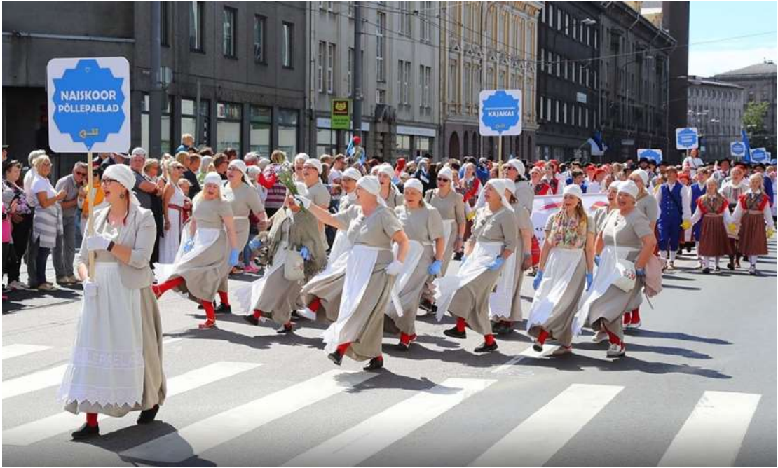
Siit me tuleme.